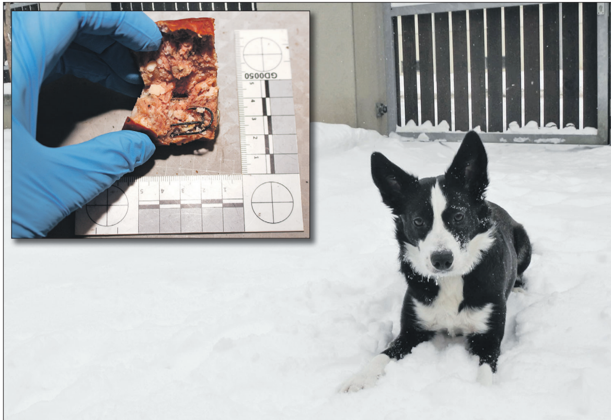
V uzenu na zahradách v Petřkovicích se našly rybářské háčky, dva psi už skončili v péči veterinářů.

„V současné době pátráme po neznámém pachateli, který na oplocené pozemky vhadzuje uzenu, do níž jsou úmyslně