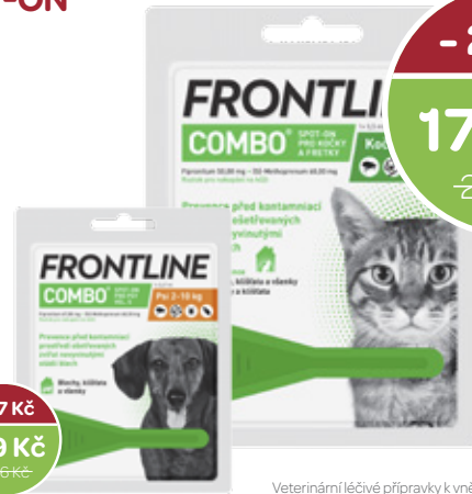
Veterinární léčivé přípravky k vnějšímu užití pro psy a kočky.