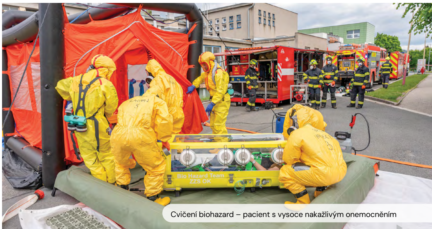
Cvičení biohazard – pacient s vysoce nakažlivým onemocněním

Nemocnice se pravidelně připravuje i na krizové situace. V loňském roce proto proběhla dvě rozsáhlá cvičení složek IZS. První bylo zaměřeno na přítomnost aktivního střelce v areálu nemocnice. ►