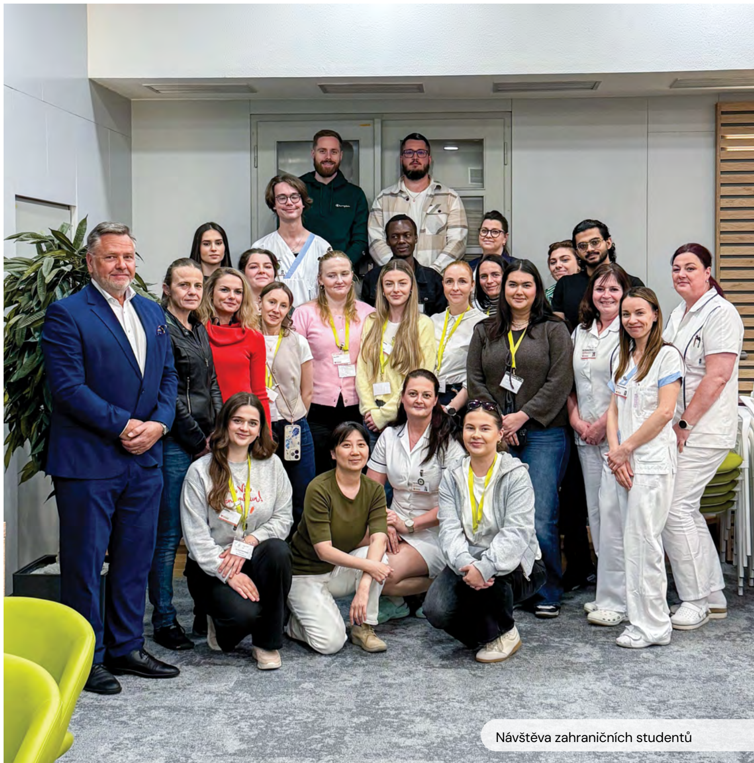
Návštěva zahraničních studentů

opět možnost nahlédnout do ostrého provozu operačního sálu, seznámili se s operačními nástroji i vedením dokumentace a vyzkoušeli si některé úkony, které k práci instrumentárek neodmyslitelně patří. Děkujeme všem studentkám a studentům za návštěvu. Věříme, že jsme je zaujali, a třeba se z některých stanou naši noví kolegové.